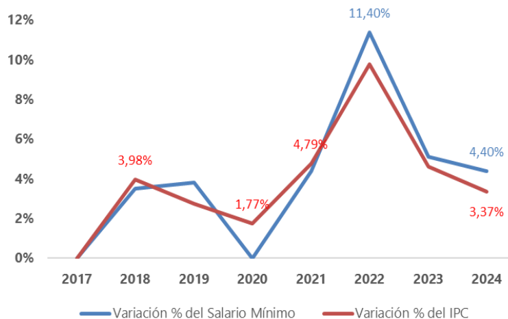
Gráfico 2. Variación porcentual del Salario mínimo y del IPC. Años 2017 - 2024.

Fuente: Elaboración Propia a partir de los datos del Banco Central del Paraguay